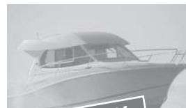
Merry Fisher 815