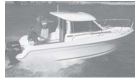
Merry Fisher 625